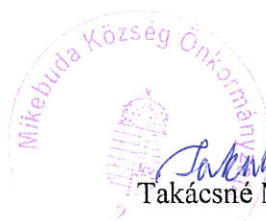
Takácsné Mocsári Ibolya polgármester